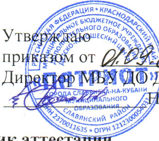
График аттестации педагогических работников аттестуемых с целью подтверждения соответствия занимаемой должности в 2025-2026 учебном году